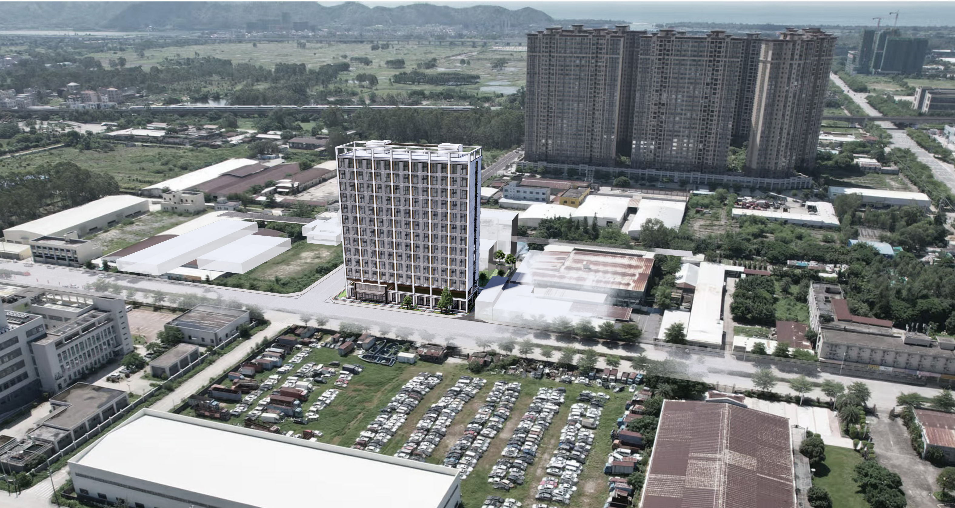
陆丰市富成源大厦 FUCHENGYUAN COMPREHENSIVE TOWER