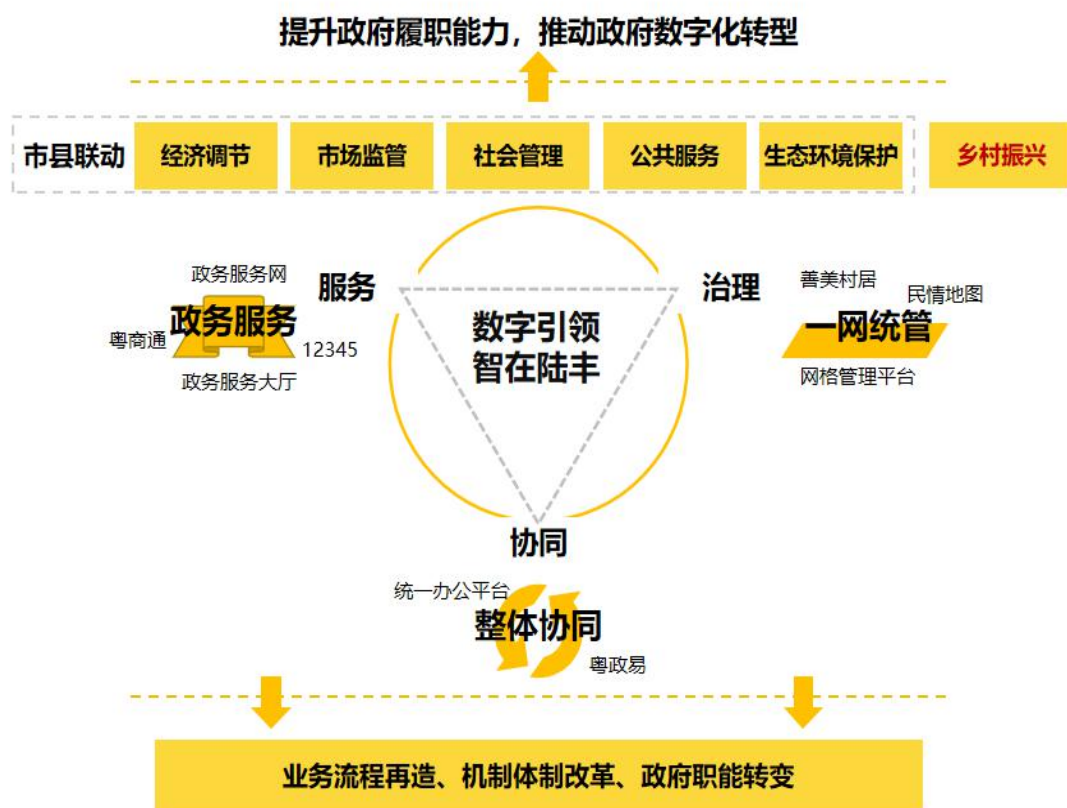
图2 陆丰市数字政府业务架构图