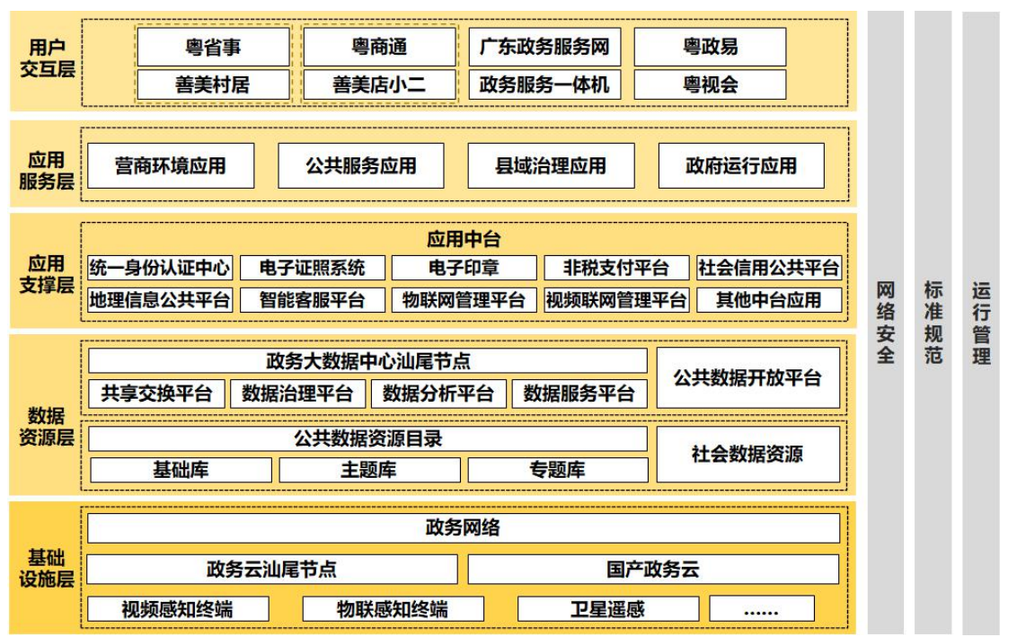
图 3 陆丰市数字政府技术架构图