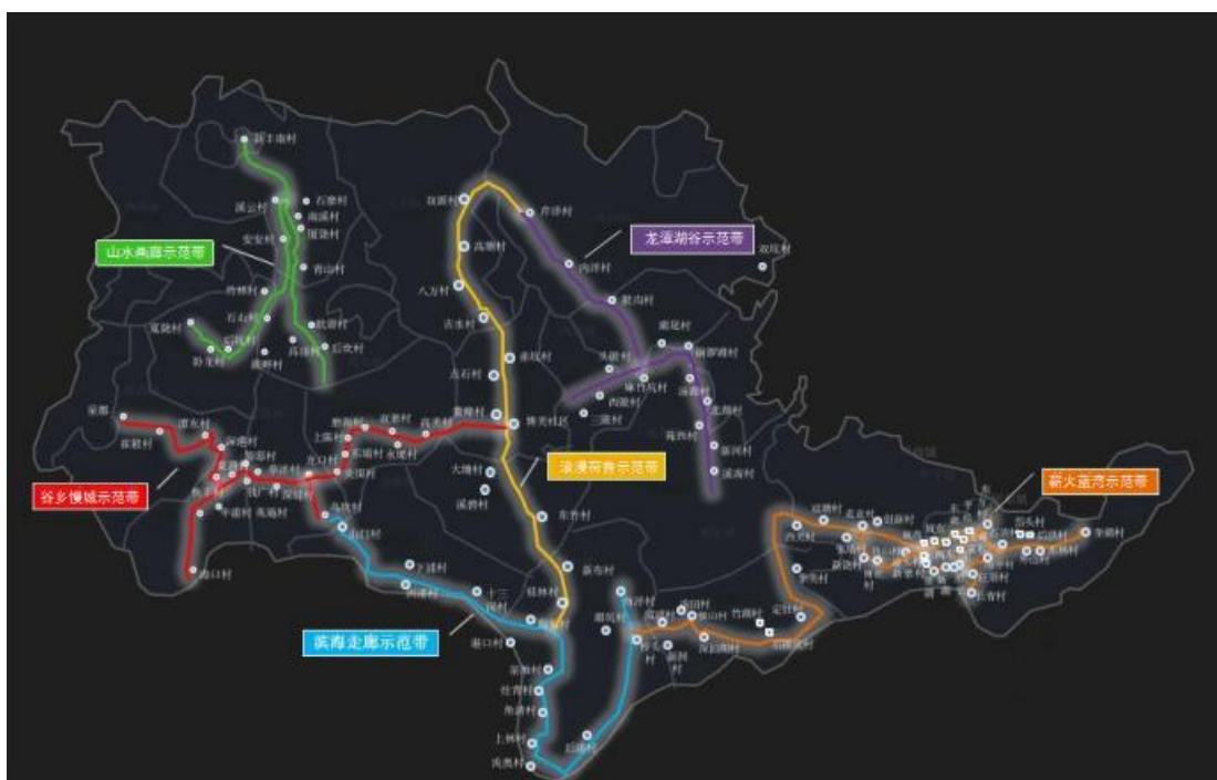
图 4 陆丰市乡村振兴示范带