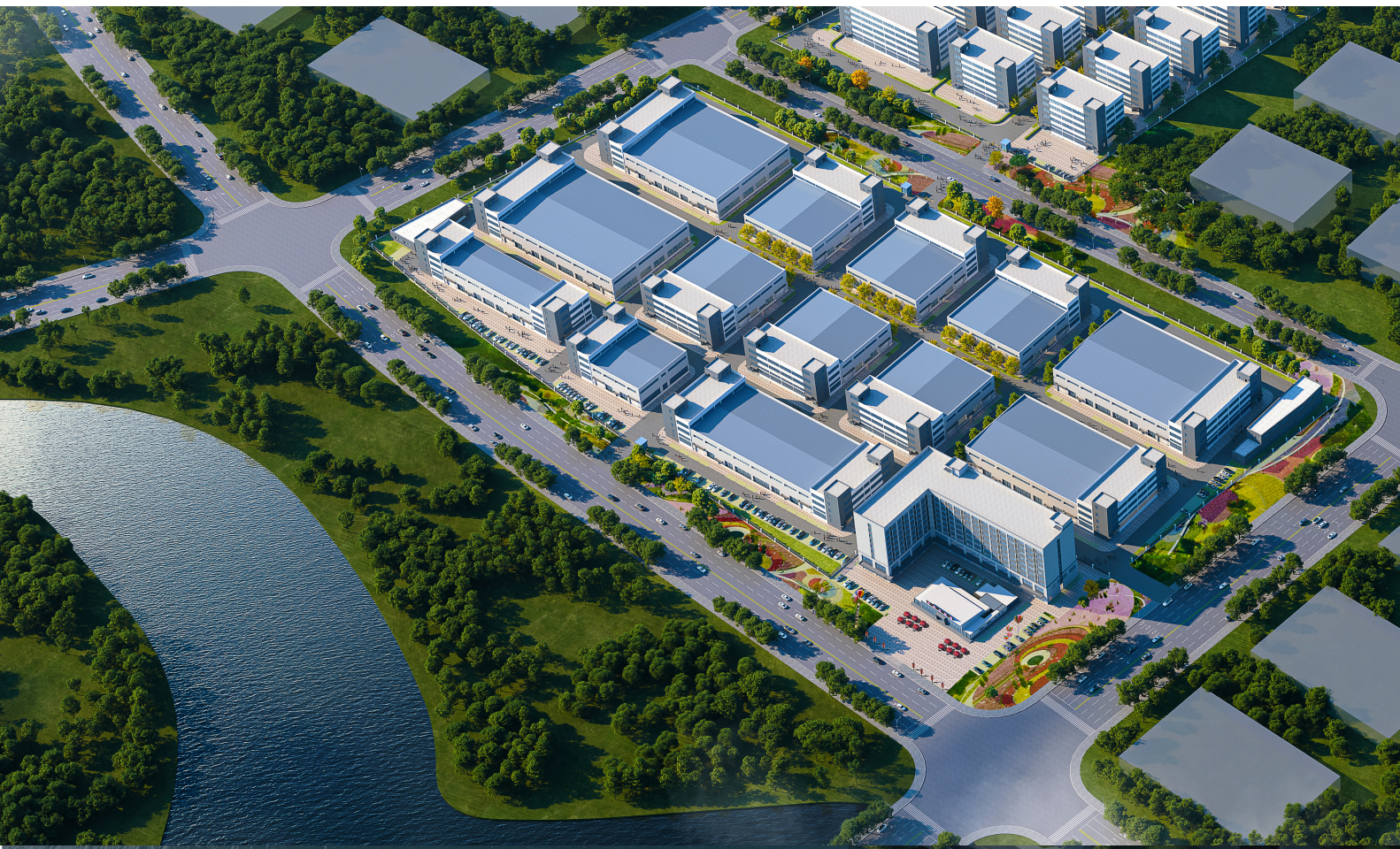
原批准方案效果图