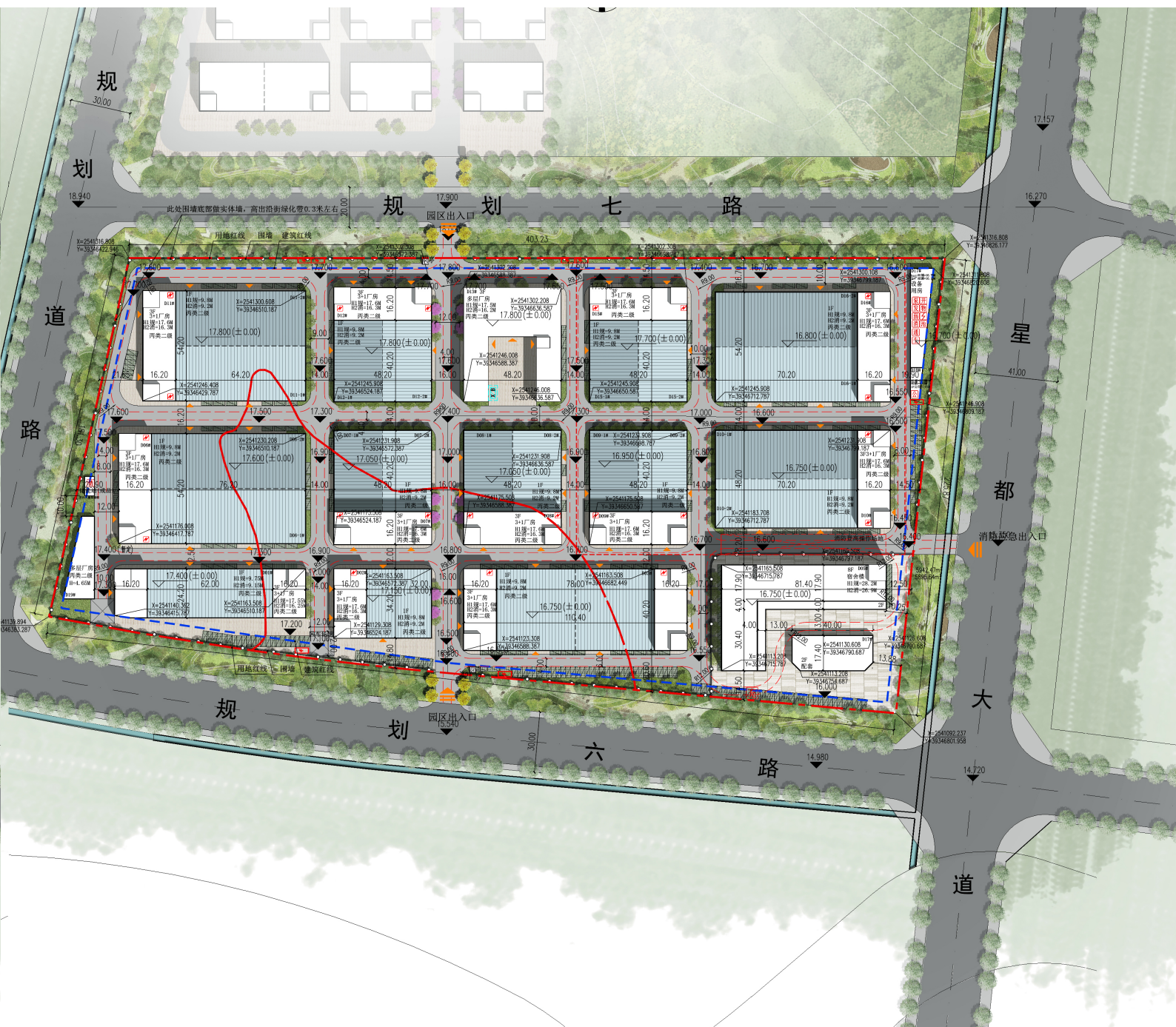
调整后方案总平图