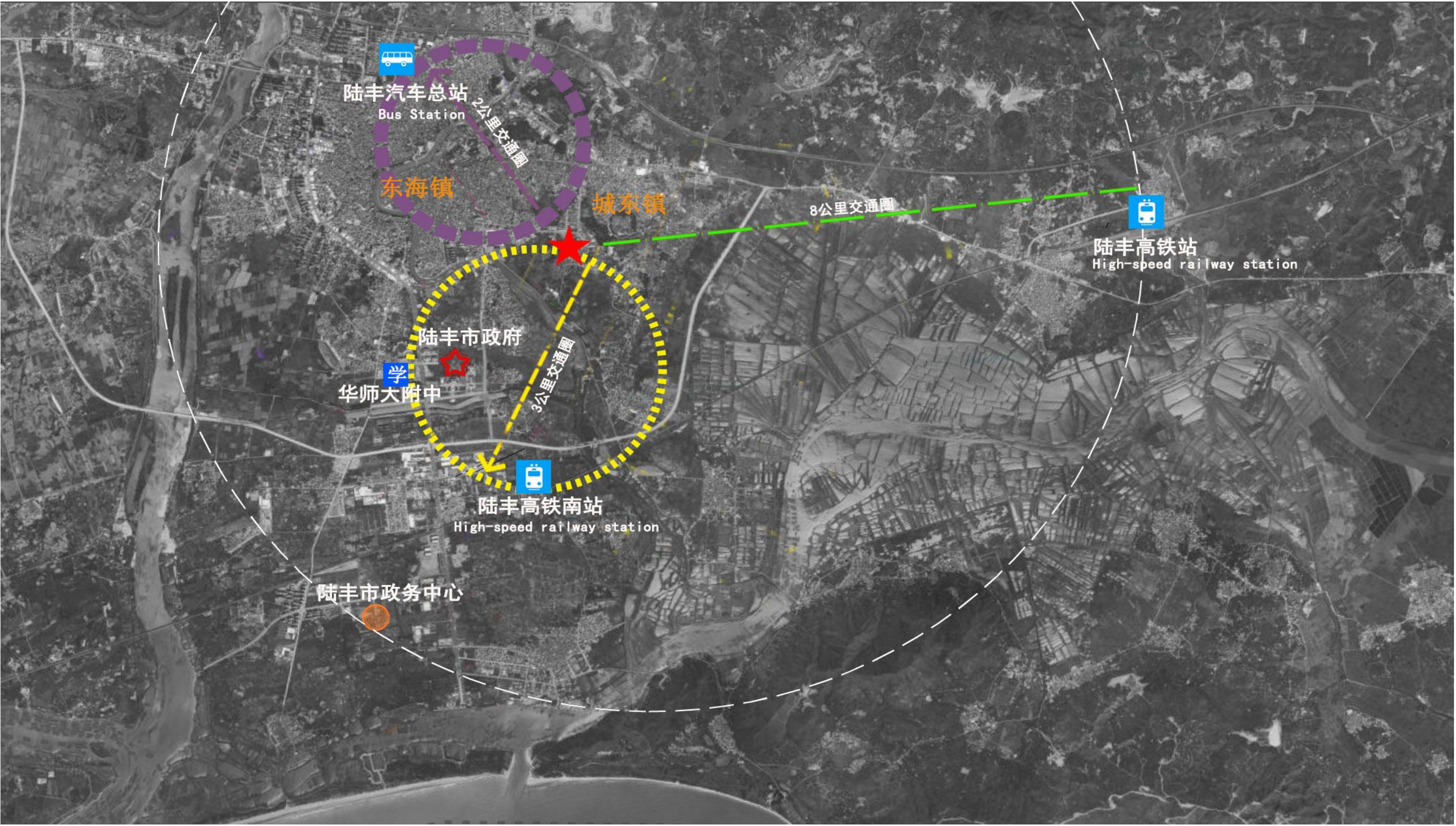
项目地处交通要道，向南3公里内有市政府及优质教学资源，向北2公里有汽车总站，向东8公里内有陆丰高铁站，地理位置优越。